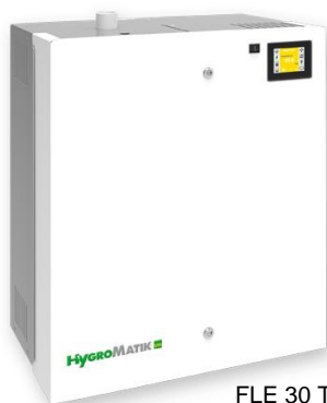
FLE 30 TSPA