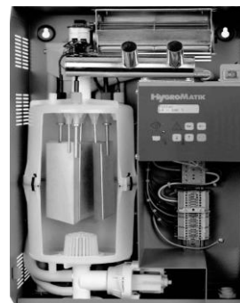
MS 10 C bez krytu