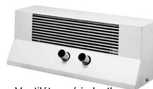
Ventilátorová jednotka VG 17

Pozn.: Označení DN znamená u hadic jmenovitou světlost mm.